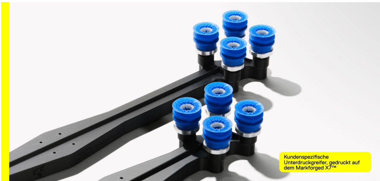
Kundenspezifische Unterdruckgreifer, gedruckt auf dem Markforged X7™